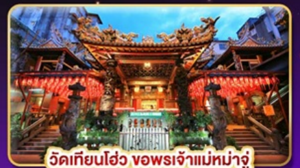
วัดเทียนโฮ่ว ขอพระเจ้าแม่หม่าจู