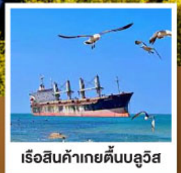
เรือสินค้าเกย์ตันบลูอิส