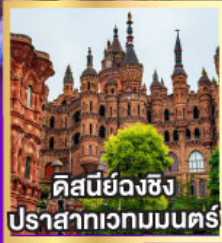
คิสนีย์วงซิ่ง ปราสาทเวทมนตร์