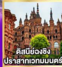
ดิสเนย์ฉิ่งฉ้าง ปราสาทเวทมนตร์