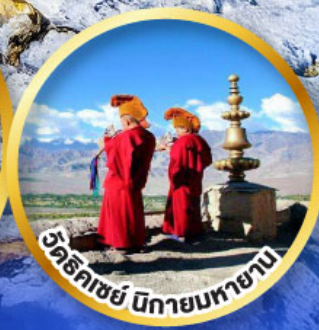
วัดริคเชย์ นิกายนทายาม