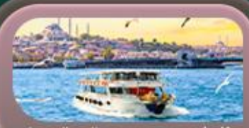
ล่องเรือ ช่องแคบบอสฟอรัส