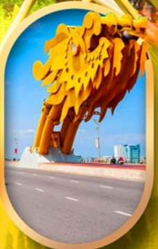
สะพานมังกรคานิง