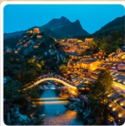
หุบเขาวังเซียนกู่