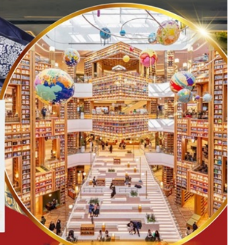
ห้องสมุด สตาร์ฟิลด์ ซูวอน

เช็คอินห้องสมุดสุดอลังการ ชมศิลปะดิจิทัลสุดล้ำ บนจอ LED เสมือนจริงขนาดยักษ์ หมู่บ้านเกาหลีโบราณมุกซอน อื่นๆ อิสระช้อปปิ้ง 2 ย่านดัง ซองซู เมียงดง ช้อปปิ้งลดภาษี Lotte Duty Free