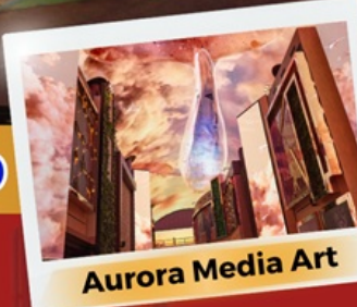
Aurora Media Art