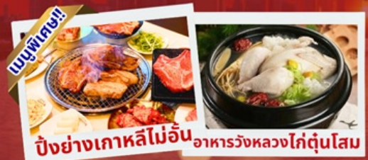
ปิ้งย่างเกาหลีไม่อั้น อาหารวังหลวงไก่ตุ๋นโสม

เช็คอินห้องสมุดสุดอลังการ ชมศิลปะดิจิทัลสุดล้ำ บนจอ LED เสมือนจริงขนาดยักษ์ หมู่บ้านเกาหลีโบราณมุกซอน อื่นๆ อิสระช้อปปิ้ง 2 ย่านดัง ซองซู เมียงดง ช้อปปิ้งลดภาษี Lotte Duty Free