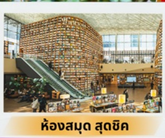
ห้องสมุด สุดชิค