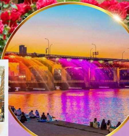
ชมสะพานน้ำพุสายรุ้ง

เชคอินเกาะนามิ สุดโรแมนติก ชมศิลปะดิจิทัลอลสุดล้ำ บนจอ LED เสมือนจริงขนาดยักษ์ สนุกสุดมันส์ สวนสนุกล็อตเต้เวิลด์ ชมต้นจูนีเปอร์จีนอายุกว่า 1,000 ปี และดอกไม้ตามฤดูกาล อิสระช้อปปิ้ง เมียงดง ช้อปปิ้งปลอดภาษี Lotte Duty Free