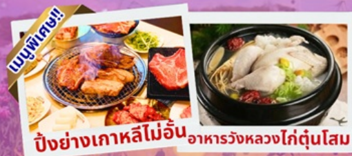
ปิ้งย่างเกาหลีไม่อั้น อาหารวังหลวงไก่ตุ๋นโสม

เชคอินเกาะนามิ สุดโรแมนติก ชมศิลปะดิจิทัลอลสุดล้ำ บนจอ LED เสมือนจริงขนาดยักษ์ สนุกสุดมันส์ สวนสนุกล็อตเต้เวิลด์ ชมต้นจูนีเปอร์จีนอายุกว่า 1,000 ปี และดอกไม้ตามฤดูกาล อิสระช้อปปิ้ง เมียงดง ช้อปปิ้งปลอดภาษี Lotte Duty Free