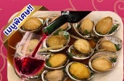
ซีฟู้ด เป้าฮ้อ+ไวน์แดง