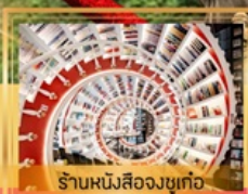
ร้านหนังสือจตุเก๋