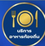
บริการ อาหารท้องถิ่น