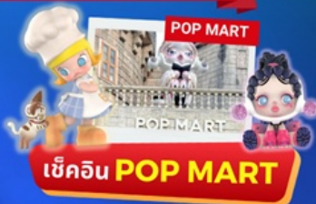
เช็คอิน POP MART