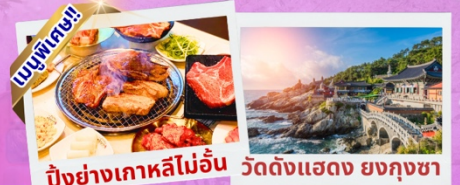
ปี้งย้างเกาหลีไม่้อิน วัดดังแฮดง ยงกุงซา

เทศกาลชมพี้อดกด จินแฮ นั้บแสนต้น เซคจินหมู่บ้านวัฒนธรรมคัมซอน นั่งรถไฟลอยฟ้า Sky Capsule นั่งกระเช้าลอยฟ้า ชมวิวทะเลปูซาน ห้ามพลาด แวะตลาดดังแฮอุนแด สักการะ วัดแฮดง ยงกุงซา อิสระชอปปีง ถนนชอมยอน ชื้อปปลอดภาษี Lotte Duty Free