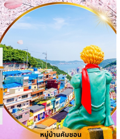
หมู่บ้านคัมซอน