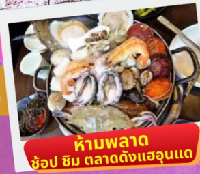
ห้ามพลาด ชื้อป ซิม ตลาดดังแฮอุนแด