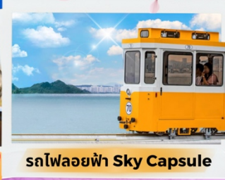
รถไฟลอยฟ้า Sky Capsule