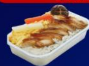
ข้าวหน้าไก่ย่างเทรียก

บริการอาหารร้อน และ น้ำดื่ม บนเครื่อง ขาไป และ ขากลับ