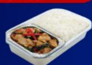
ข้าวกะเพราไก่