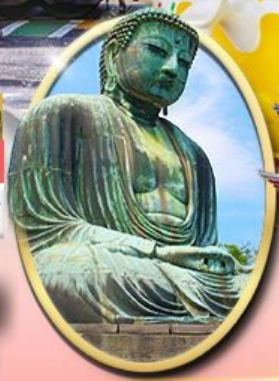
พระใหญ่คามาคุระ