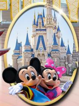
อิสระเลือกซื้อบัตร Tokyo Disneyland