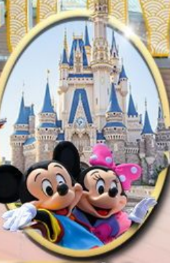
อิสระเลือกซื้อบัตร Tokyo Disneyland