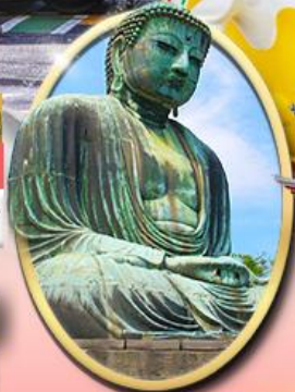
พระใหญ่ตามาคุระ