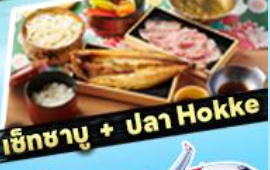
เอ๊กซาซุ + ปลา Hokke