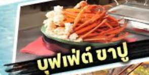
บุฟเฟต์ ชาบู