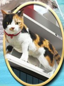
ซอยบิง ชินจูกุ