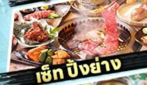
เซ็ท บิงย่าง