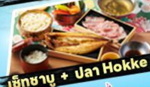
เซ็ทชาบู + ปาฮา Hokke