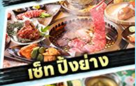
เอ๊ก บิงย่าง