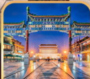
ถนนเจียนเหมิน