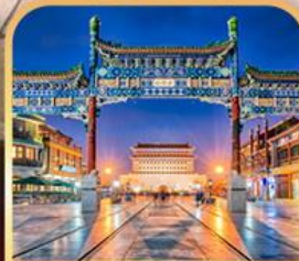
ถนนเทียนเหมิน