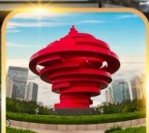
จตุรัสห้าสี