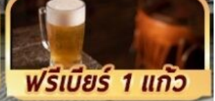
ฟรีเบียร์ 1 แก้ว