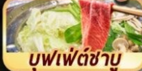
บุฟเฟต์ซาบู