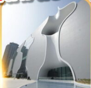
โรงละครโดจง