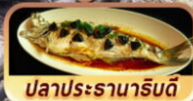
ปลาประจานาโรยดี