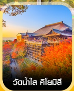
วัดน้ำใส คิโอมิซึ