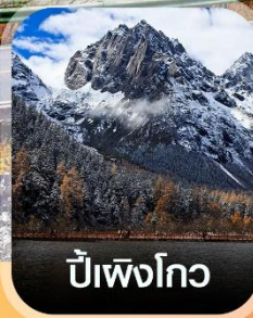
ปีเหมิงโกว

✈️ คอนเฟิร์มออกเดินทาง ทุกปีเรียด 2 ท่านขึ้นไป ✈️