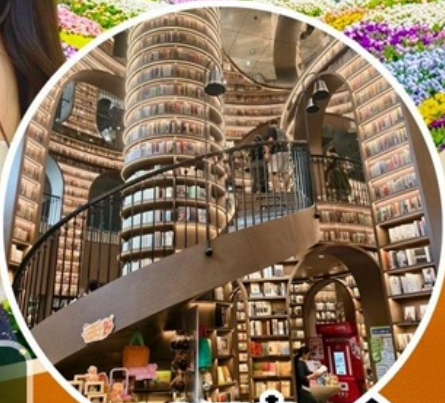
จางชู่เก๋อ

สวนสวรรค์แห่งดอกไม้ MANHUA-จางชู่เก๋อ-จัตุรัสหย่างเทียนวู่-รูบิ่นแพนต้าเชลฟ์ เมืองโบราณกวนเซี่ยน-อุทยานเขาสี่ดรุณี(รวมรถอุทยาน)-สะพานหนานเจียว เมืองลั่วไถ่-ตึกแฝด-SKP-วัดต้าเจ้อ-ถนนคนเดินซันซีลู่-IFS-ตงเจียวจี้-ถนนคนเดินไท่ทงลี่