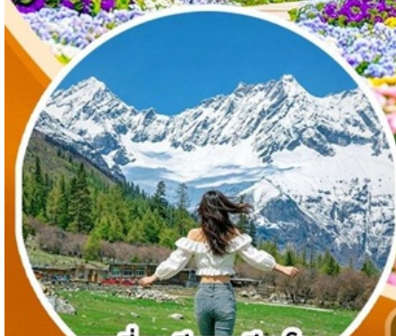
ภูเขาสี่ดรุณี ช่วงเดียวไกล (รวมรถอุทยาน)