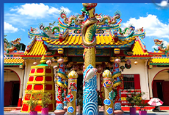
วัดพรตเจ้าท่ามกษิย์