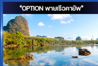
*OPTION พายเรือคายัค*