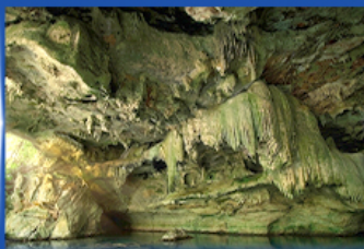
ถ้ำทะเลแหวก Unseen Thailand