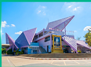
ด่านพรมแดนช่องเม็ก