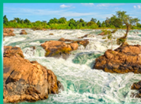
น้ำตกหลี่ม