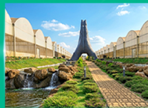
Agro Vege Farm