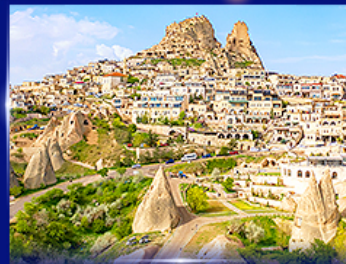
หุบเขาอูซึซาร์ คัมปาโตเกีย