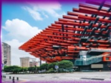
แลนด์มาร์กฉิ่ง ตึกตะเกียบ