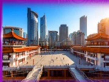
เข็คฉิน ตึกโค่วซิงโห