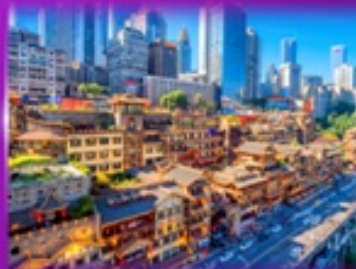
เข็คฉินย่านฉิ่ง หงหยาดฉิ่ง