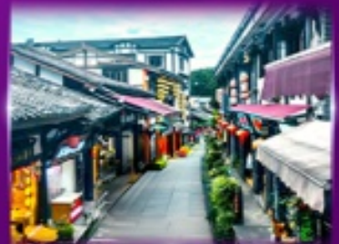
หมู่บ้านโบราณฉิ่งซีโหว่