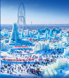
เทศกาลหิมะและน้ำแข็ง 2027