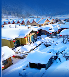
หมู่บ้านหิมะ สโนว์ทาวน์