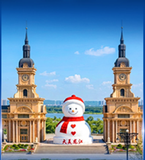
ตุ๊กตาหิมะยักษ์ ฮาร์บิน