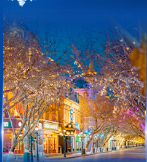
ย่านจงหยาง สตริท