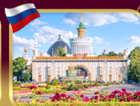
สวนสาธารณะ VDNKH