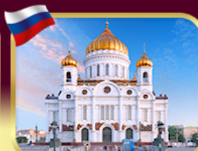
มหาวิหารเซนต์ซาเวียร์