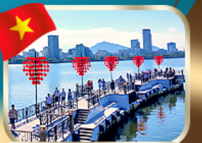
เช็คอินสะพานแห่งความรัก ดานัง