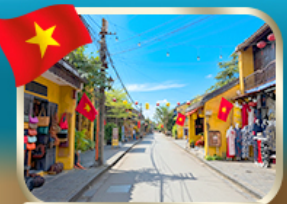
เที่ยวชมเมืองเก่ามรดกโลก ฮอยอัน