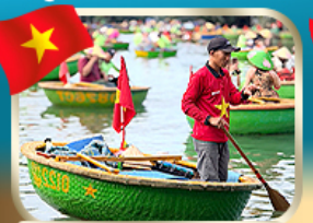
ล่องเรือกระด้ง ชมหมู่บ้านกัมกาม