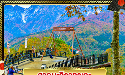
ฮาคุบะฮิวากาเตะ