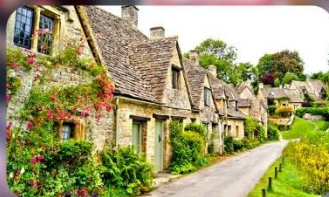
หมู่บ้านไบบิวรี