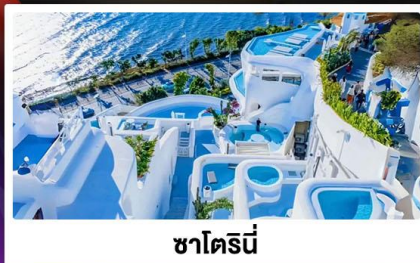
ซาไดร์นี่