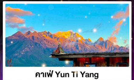
กาแฟ Yun Ti Yang

🚄 บริการ นั่งรถไฟ ความเร็วสูง ฟรี! รถชuttle