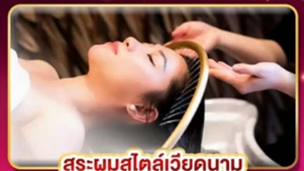
สระผมสไตล์เวียดนาม