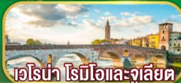
เวโรน่า โรมิโอและจูเลียต