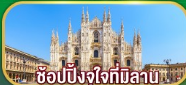
ซ็อบปังจุงใจที่มีลาน