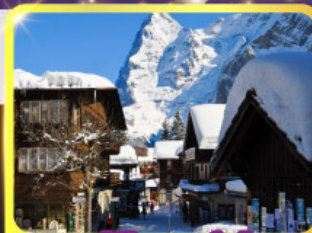
หมู่บ้านมูร์เร็น