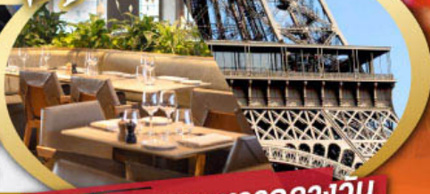
รับประทานอาหารกลางวัน บนหอคอยไอเฟล