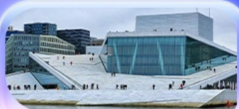
โอเปร่าเฮาส์

07-15 ต.ค.69 / 16-24 ต.ค.69 13-21 พ.ย. 69 / 04-12 ธ.ค. 69 25 ธ.ค. 69 - 02 ม.ค. 70 (ปีใหม่)