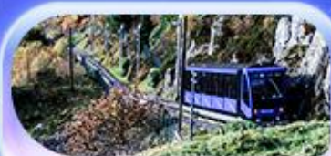
นั่งรถรางขึ้นยอดเขาฟลอยอน

เปิดประสบการณ์สุดจ้าว... สักครั้งในชีวิต! ล่องเรือชมฟยอร์ด