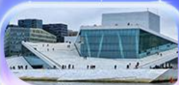
โอเปร่าเฮาส์

07-15 ต.ค.69 / 16-24 ต.ค.69 13-21 พ.ย. 69 / 04-12 ธ.ค. 69 25 ธ.ค. 69 - 02 ม.ค. 70 (ปีใหม่)