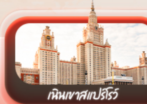
เหมินเขาสเปร์โรว์