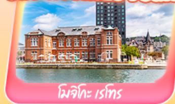
โมจิโกะ ไร่โท