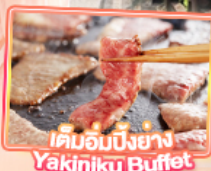
เด็มอิมบิงย่าง Yakiniku Buffet