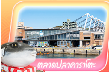
ตลาดปลาคาราโตะ

ถ่ายภาพปราสาทโคกูระ ช้อปบิงจุกุเิกิ เอาท์เล็ตคิตะคิซุ