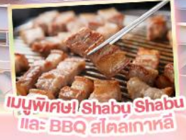
เมนูพิเศษ! Shabu Shabu และ BBQ สไตล์เกาหลี