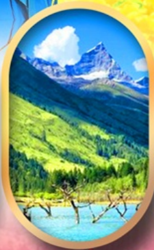
อุทยานสี่ตุ๋น