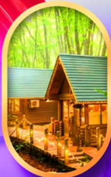
นิงเกิลทอเรส