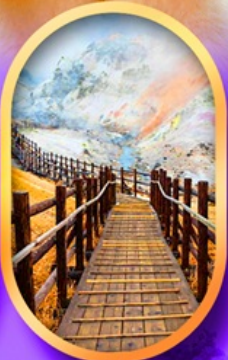
จโกคุดานิ