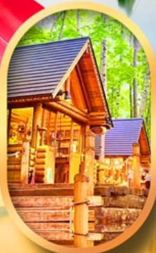
นิงเกิลทอรัส