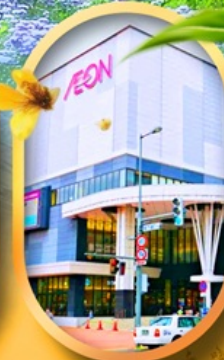
อ็อนมอลล์