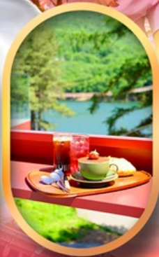
คาเฟ่ลิลกลางป่า