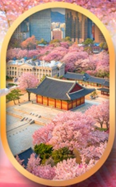
พระราชวังชางด็อกกุง