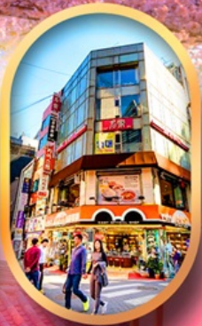
ช้อปปิ้งย่านเมียงดง