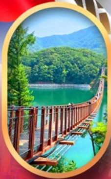
สะพานเขอนมาจิง