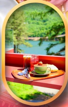
คาเฟ่ลับกลางป่า