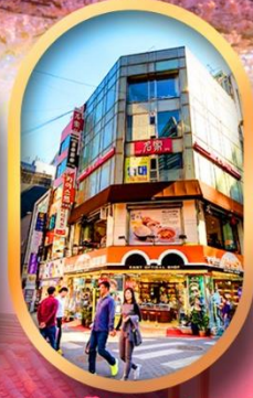
ช้อปปิ้งย่านเมียงดง