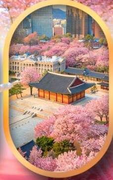
พระราชวังชางด็อกกุง