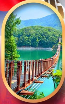
สะพานแขวนมาจิง