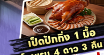
เปิดปิกทั้ง 1 มื้อ

พักโรงแรม 4 ดาว 3 คืน ไฮไลท์ สุดจาว! ขึ้นลิฟท์แก้วชมความอลังการ กลางหุบเขา