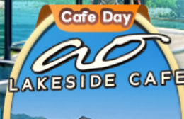
Ao Lakeside Cafe