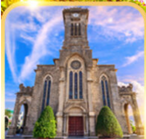
โบสถ์หินญางจาง