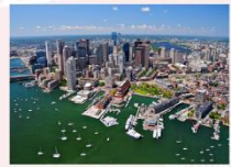
เมืองบอสตัน

** พักที่ Crown Plaza Boston Hotel 4* หรือเทียบเท่า **