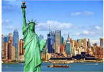
นครนิวยอร์ก

05.20 น. เดินทางถึงสนามบินอิสตันบูล (แวะเปลี่ยนเครื่อง) 07.05 น. ออกเดินทางสู่นครนิวยอร์ก เที่ยวบิน TK3 10.45 น. เดินทางถึงสนามบินจอห์น เอฟ เคนเนดี นิวยอร์ก