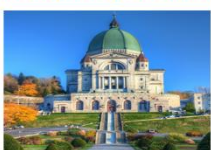
โบสถ์เซนต์โจเซฟแห่งมหานครออตตาวา