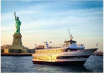
นั่งเรือสู่เกาะลิเบอร์ตี