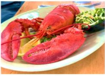
เมนูพิเศษ กุ้ง Lobster