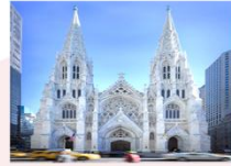
St. Patrick's Cathedral

** พักที่ Holiday Inn Express & Suites Jersey City Hotel 4* หรือเทียบเท่า **