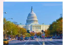
กรุงวอชิงตัน ดี.ซี.

** พักที่ Staybridge Suites Tysons McLean Hotel 4* หรือเทียบเท่า **