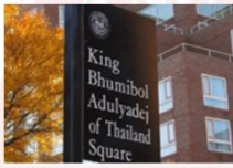
จัตุรัสสมเด็จพระอตุลยเดช