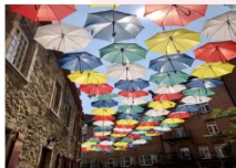
เมืองควิเบก

xx.xx น. ออกเดินทางสู่เมืองควิเบก เที่ยวบิน ... xx.xx น. เดินทางถึงสนามบินเมืองควิเบก ประเทศแคนาดา