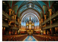
วิหารนอร์ธเทอดาม

** พักที่ Holiday Inn Express & Suites Ottawa Hotel 4* หรือเทียบเท่า **