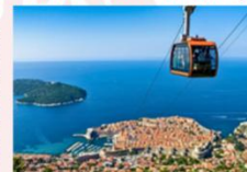
Cable Car Ride