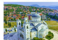
Cathedral of the Resurrection of Christ

20.40 น. ออกเดินทางสู่สนามบินอิสตันบูล เที่ยวบิน TK1088