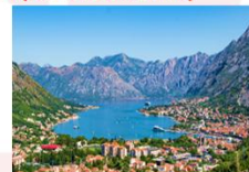
เมืองกอเตอร์

** พักที่ Bracera Hotel 4* หรือเทียบเท่า **