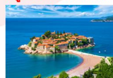
หมู่บ้านสเวติ สเตฟาน