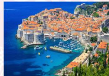
เมืองดูบรอฟนิค