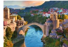
สะพานเก่า Mostar

** พักที่ City Hotel 4* หรือเทียบเท่า **