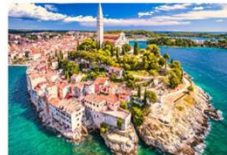
เมืองโรวินจ์