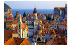
เมืองเก่า

** พักที่ Adria Hotel 4* หรือเทียบเท่า **