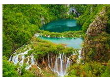
อุทยานแห่งชาติทะเลสาบพลิทวิเซ

** พักที่ Bellevue Hotel 4* หรือเทียบเท่า **