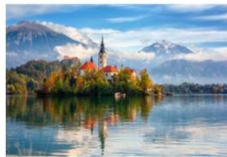
ทะเลสาบเบลด

05.15 น. เดินทางถึงสนามบินอิสตันบูล และเปลี่ยนเครื่อง 07.15 น. ออกเดินทางสู่เมืองลูบลยานา ประเทศสโลวีเนีย เที่ยวบิน TK1061 08.30 น. เดินทางถึงสนามบินลูบลยานา โจเซ ฟุซนิค