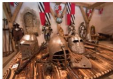
ปราสาทเพรจามา

** พักที่ Radisson Blu Plaza Hotel 4* หรือเทียบเท่า **