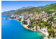
เมืองโอพาเทีย

** พักที่ Paris Hotel 4* หรือเทียบเท่า **