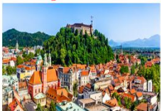
เมืองเก่า