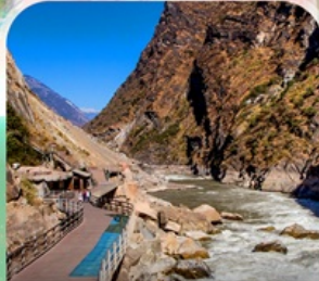
ช่องแคบเลือกระโจน