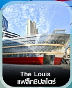
The Louis แฟล็กชิพไคร์