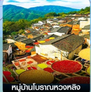
หมู่บ้านโบราณหวงหลิง (หมู่บ้านตากพรัก)